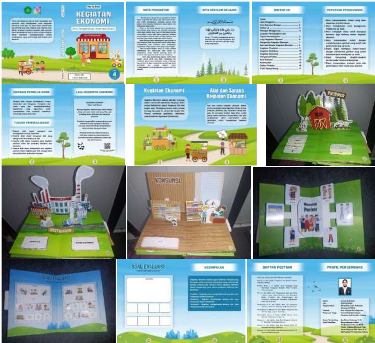
Gambar 1. Media Pop-Up Book Materi Kegiatan Ekonomi

Media pop-up book berisi halaman pengantar, doa sebelum belajar, daftar isi, petunjuk penggunaan, CP dan TP, lagu materi kegiatan ekonomi, materi, evaluasi, kesimpulan, daftar pustaka dan profil pengembang. Peneliti memberikan beberapa model pop-up dengan gambar yang mendukung sehingga media dapat menarik minat peserta didik.