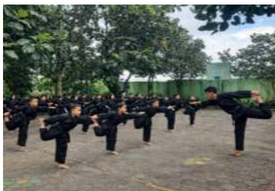
Gambar 5 Disiplin Kepatuhan Latihan