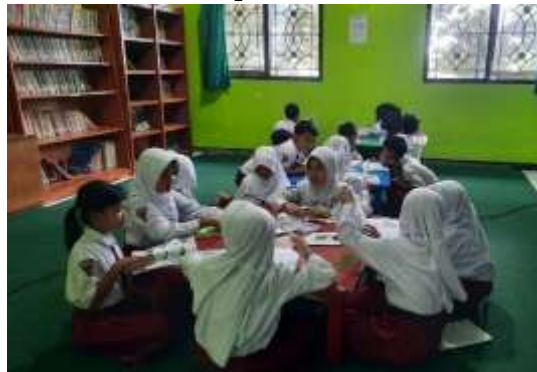
Gambar . Disiplin Waktu Literasi

Implementasi program literasi di SDN Merjosari 4 Malang secara signifikan berkontribusi pada pembentukan disiplin waktu siswa melalui proses habituasi yang konsisten. Hasil penelitian menunjukkan bahwa jadwal rutin memberikan struktur transisi yang jelas antara pembelajaran formal dan literasi, sehingga siswa mulai menunjukkan kesiapan mandiri tanpa perlu pengingat berulang. Berdasarkan hasil wawancara dan dokumentasi, kesadaran pengelolaan waktu ini berkembang dari sekadar ketaatan terhadap instruksi menjadi motivasi internal untuk menghindari konsekuensi negatif dan menjaga ritme kegiatan. Kesiapan siswa dalam menyiapkan bahan bacaan dan menempati posisi secara tertib mencerminkan bahwa pengalaman berulang dalam rutinitas harian sekolah efektif mentransformasi perilaku insidental menjadi karakter disiplin yang stabil.