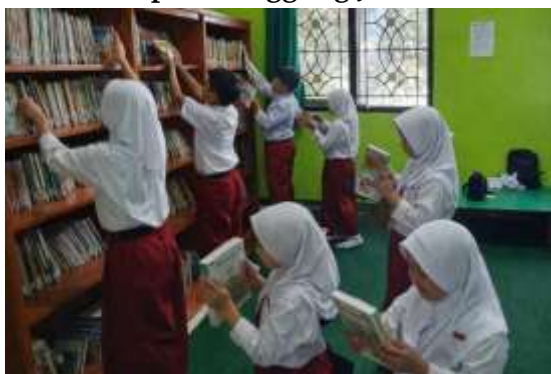
Gambar 3 Disiplin Tanggung Jawab Literasi

Untuk mempermudah pemahaman terhadap tiga dimensi disiplin yang terbentuk melalui program literasi, tabel berikut menyajikan ringkasan perilaku dan proses pembentukan disiplin siswa: