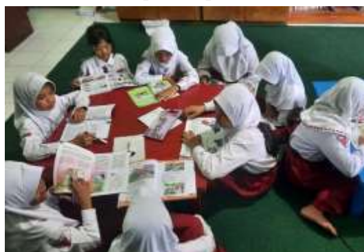
Gambar 2 Disiplin Kepatuhan Literasi

Program literasi di SDN Merjosari 4 Malang berfungsi strategis sebagai ruang pembiasaan siswa dalam menaati regulasi sekolah secara konsisten. Hasil penelitian menunjukkan bahwa kepatuhan siswa, yang meliputi aspek menjaga ketenangan, kemandirian menyiapkan bahan bacaan, dan penghormatan terhadap suasana belajar, dibangun melalui sinergi antara aturan formal tertulis dan pengawasan edukatif guru. Berdasarkan data wawancara dan dokumentasi, internalisasi nilai kepatuhan ini berkembang dari sekadar kepatuhan terhadap instruksi lisan menjadi kesadaran personal bahwa ketertiban mendukung kelancaran aktivitas kolektif. Dengan demikian, rutinitas literasi berhasil mentransformasi tata tertib menjadi pola perilaku stabil, di mana siswa menunjukkan komitmen terhadap aturan tanpa memerlukan pengingat berulang.