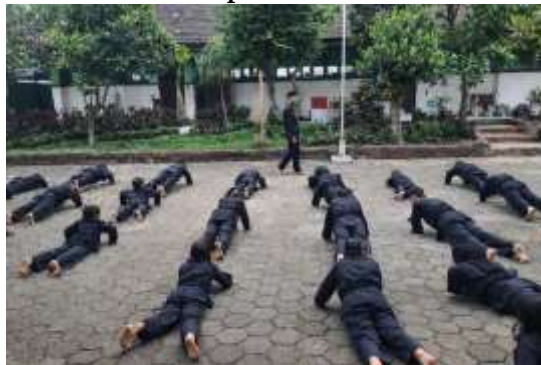
Gambar 4 Disiplin Waktu Latihan

Ekstrakurikuler pencak silat PSHT di SDN Merjosari 4 Malang berkontribusi signifikan terhadap internalisasi disiplin waktu siswa melalui mekanisme habituasi dan keteladanan. Hasil penelitian menunjukkan bahwa ketepatan waktu dibangun melalui penetapan jadwal rutin, kesiapan atribut latihan, serta pemberian sanksi edukatif yang konsisten oleh pelatih. Data wawancara dan dokumentasi mengonfirmasi adanya pergeseran perilaku siswa dari kondisi kurang teratur menjadi lebih mandiri dan responsif terhadap jadwal, bahkan berdampak positif pada aktivitas akademik lainnya. Melalui figur pelatih sebagai role model dan pengalaman konsekuensi langsung, disiplin waktu bertransformasi dari sekadar kepatuhan formal menjadi kesadaran personal yang tecermin dalam kesiapan siswa sebelum latihan dimulai.