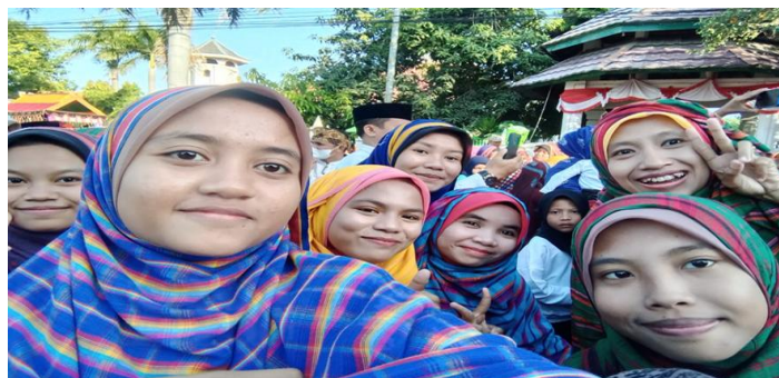
Gambar 3. festival rimpu sebagai bentuk pelestarian budaya lokal.