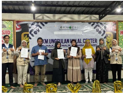
Gambar 4. Penyerahan sertifikat halal kepada para pelaku UMKM.