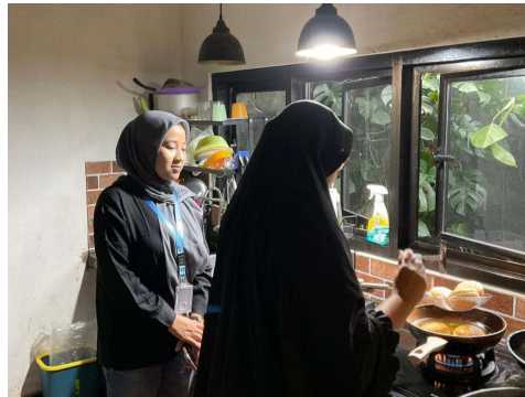
Gambar 3.2 Kegiatan pendampingan dalam proses sertifikasi halal.