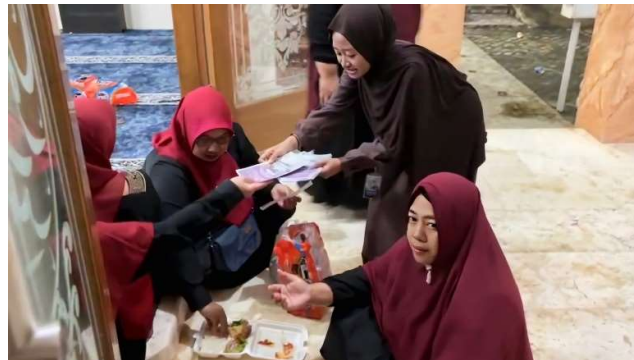
Gambar 3.1 Proses sosialisasi sertifikasi halal.