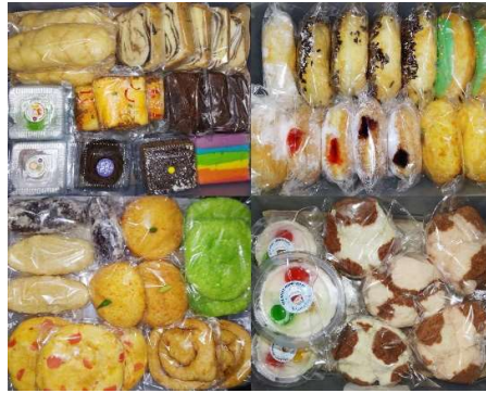
Gambar 2. Contoh produk UMKM dengan dan tanpa label halal.