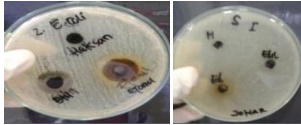
Gambar 1. Hasil uji aktivitas antibakteri ekstrak n-heksan, etil asetat dan etanol pada bakteri Staphylococcus aureus (kiri atas), Micrococcus luteus (kanan atas), Escherichia coli (kiri bawah) dan Shigella dysenteriae (kanan bawah)