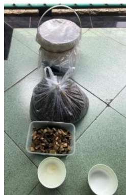
Gambar 1. Alat dan bahan