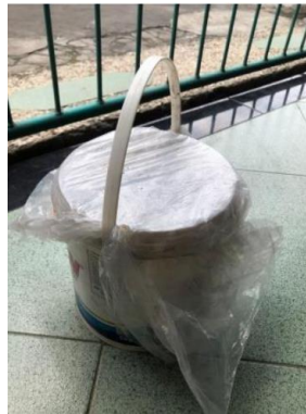
Gambar 6. Langkah pembuatan ke-6