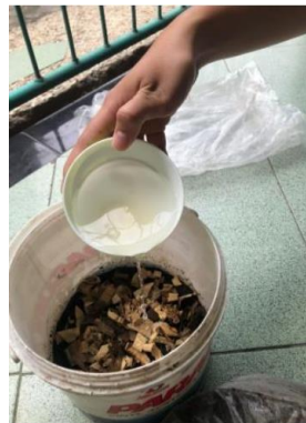
Gambar 3. Langkah pembuatan ke-3