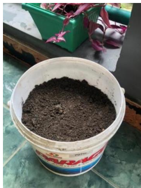
Gambar 7. Langkah pembuatan ke-7