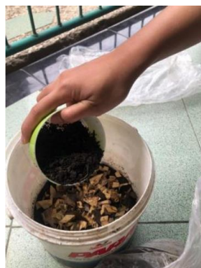
Gambar 4. Langkah pembuatan ke-4