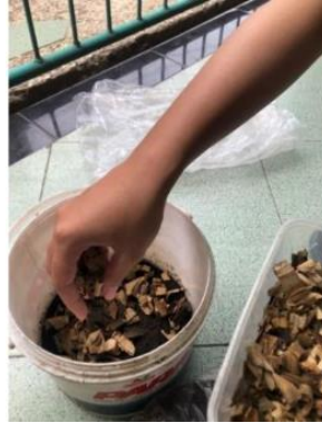
Gambar 2. Langkah pembuatan ke-2